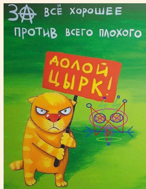
Картина Васи Ложкина. Из открытых источников