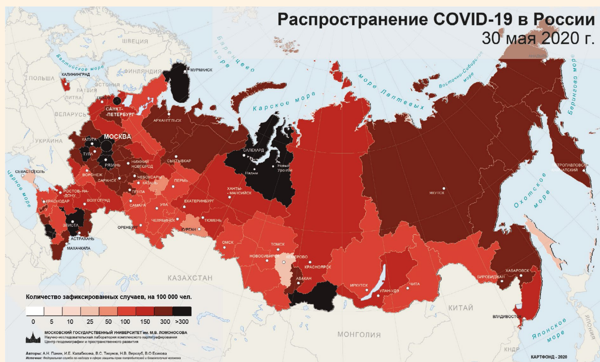
Рисунок 2. Пример картографирования регионального рейтинга распространённости коронавируса 2