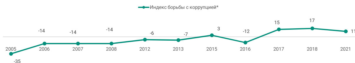
Диаграмма 4. Динамика индекса борьбы с коррупцией...* (индекс коррупции**)

* За 2005—2018 гг. опубликовано на сайте ВЦИОМ.