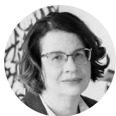
ЛЮДМИЛА ПЕТРАНОВСКАЯ семейный психолог, Москва