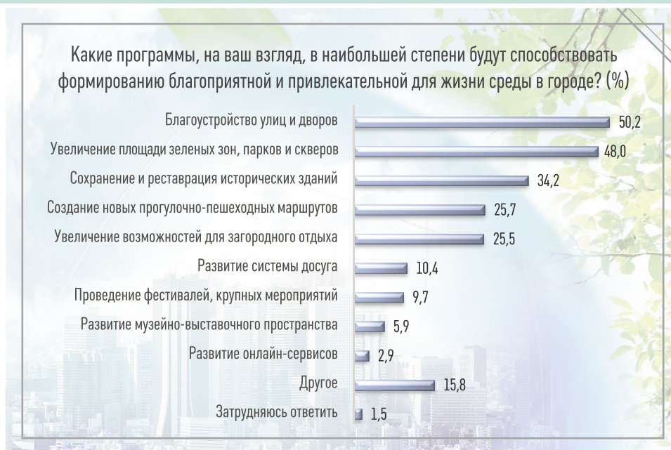
Рис. 4. Рейтинг мер, направленных на формирование благоприятной окружающей среды (результат исследования в Томске)

ных аэропортов, возможности развития речных маршрутов по Оке создают благоприятные условия для путешествий в Серпухов и его окрестности. Но, к сожалению, этим мечтам не суждено сбыться, пока свалки и мусорные полигоны отравляют и без того неблагоприятную городскую экологию.