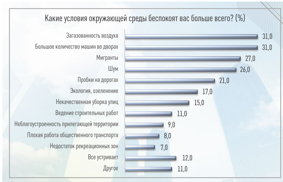
Рис. 2. Влияние факторов окружающей среды на здоровье человека (результат исследования в Москве)

приоритетов для формирования общественного здоровья жители Москвы также выделяют необходимость увеличения площади озелененных территорий (парков, скверов) и прогулочных маршрутов, строительство объектов спорта и дополнительные меры по борьбе с вредными привычками.